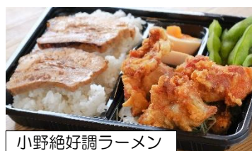
小野絶好調ラーメン 唐揚げ弁当 ¥500