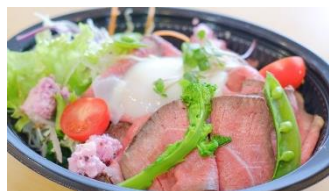
マトウラーレ ローストビーフ丼 ¥800