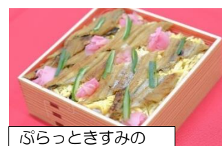
ぷらっときすみの 穴子ちらし ¥780