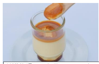
共進牧場レストラン ミルカース 極上ジャージープリン ¥500