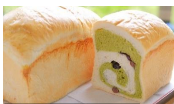
誉田の館いろどり 抹茶ばん1.5斤 ¥1,000