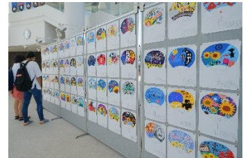
昨年のうちわデザイン展の様子

小野まつりは新型コロナウイルスの影響で中止となりましたが、 毎年恒例のうちわデザインコンテストには、227点の応募がありました！ 今年も色鮮やかなデザインが勢揃い。 ぜひ、うちわデザイン展で夏を感じてください。