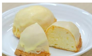
パティスリーケイスケ しあわせ色のレモンケーキ ¥160