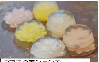
お菓子の家シェシエ フラワーゼリー 1個¥300