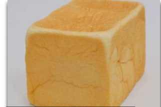
食 Pain no mie 美つる 食パン1.5斤 ¥590