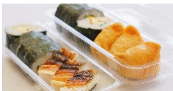
あけぼの寿司 巻きずし穴子セット ¥520