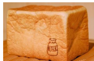
みるく村808 ミルクパン「源」1.5斤 ¥650