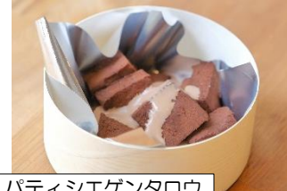
パティシエグンタロウ チョコわらび ¥500