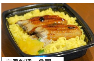
京風料理 魚司 うなぎ丼 ¥600