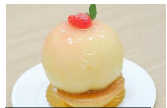
パティスリーアプレシエ 桃まるごとタルト ¥850