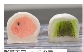
彩菓工房 もちの実 果実大福 1個¥250~