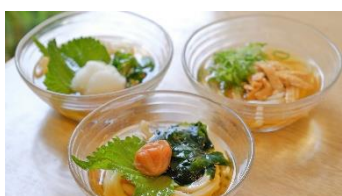
えびす庵 冷かけ梅わかめうどん ¥580