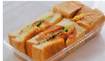
クレオール珈琲店 ホットサンド ¥550