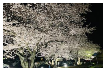
おの桜つつみ回廊 桜のトンネルや逆さ桜にうっとり。