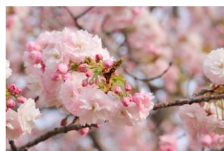
桜つつみやなせ苑 やわらかな日差しの中咲く、可愛い八重桜。