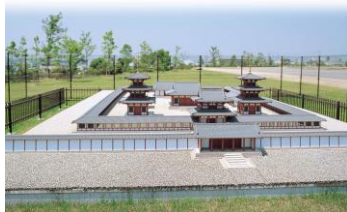
広渡廃寺跡歴史公園