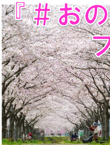
昨年度「最優秀賞」受賞作品 (おの桜つつみ回廊)